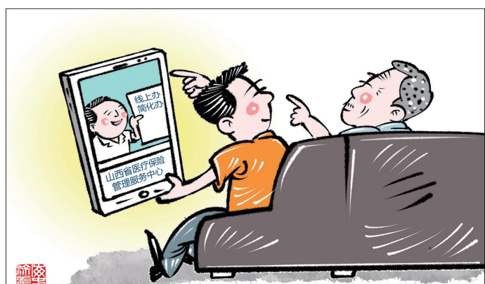
不跑趟办医保 商海春 作

优质医疗资源分布不均、医疗管理传统粗放、医疗救治存在“死角”等问题是我国医疗卫生体系长期存在的老问题,