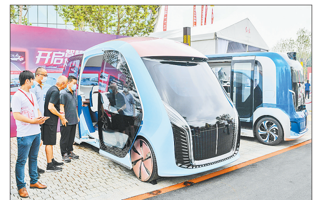
7月28日,参观者参观红旗无人自动驾驶概念车。当日,长春国际汽车文化节暨第二届红旗嘉年华在长春开幕。来自社会各界的参观者近距离接触红旗品牌各款车型,感受红旗汽车文化。

据新华社北京7月28日电(记者胡喆)7月27日,北京航天飞行控制中心飞控团队与中国空间技术研究院试验队密切配合,控制“天问一号”探测器在飞离地球约120万公里处回望地球,利用光学导航敏感器对地球、月球成像,获取了地月合影。在这幅黑白合影图像中,地球与月球一大一小,均呈新月状,在茫茫宇宙中相互守望。