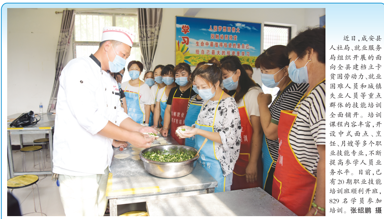
近日,成安县人社局、就业服务局组织开展的面向全县建档立卡贫困劳动力、就业困难人员和城镇失业人员等重点群体的技能培训全面铺开。培训课程内容丰富,开设中式面点、烹饪、月嫂等多个职业技能专业,不断提高参训人员业务水平。目前,已有20期职业技能培训班顺利开班,829名学员参加培训。

本报讯(通讯员张中奇)日前,省市场监督管理局官网公示了2020年度河北省知识产权优势示范企业名单,新兴铸管股份有限公司荣获“2020年度知识产权示范企业”和“2020年度知识产权优势企业”两项荣誉。据悉,随着知识产权管理体系的不断完善,新兴铸管通过调整专利指标以及修改专利合同条款,在确保申请量整体增长的同时,提高发明专利的申报比例,不断构建高价值专利,结合研发项目,加快成果转化。