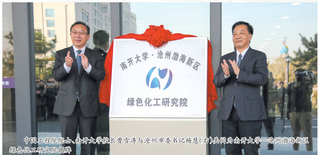
中国工程院院士、南开大学校长曹雪涛与沧州市委书记杨慧(右)共同为南开大学—沧州渤海新区绿色化工研究院揭牌