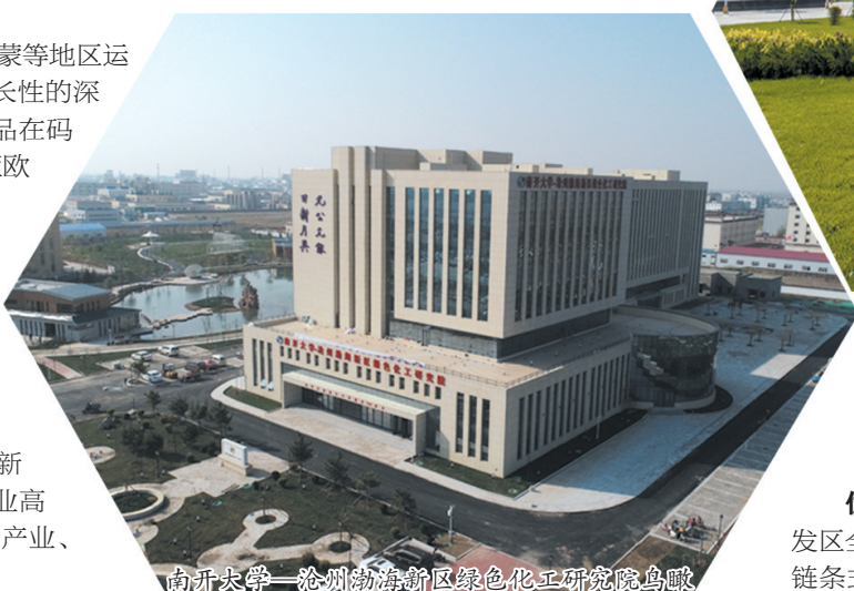
南开大学—沧州渤海新区绿色化工研究院鸟瞰

开发区不仅被《京津冀协同发展规划纲要》纳入东部滨海发展区,成为省市倾力打造的沿海率先创新发展增长极,也被《河北雄安新区规划纲要》确定为雄安新区出海口,担负起打造雄安新区清洁能源供应基地、制造业协作基地、科技成果转化基地的光荣使命。2019年,省委、省政府出台《关于加快渤海新区高质量发展的实施方案》和《关于支持生物医药产业高质量发展的若干政策》,明确提出鼓励全省绿色石化产业、生物医药产业向渤海新区和临港开发区聚集。