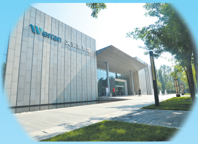
文安县规划馆。

2020年,文安县将加大基础设施、生态环境、新城建设力度,全面提升产城融合的“硬”环境;重拳出击,打好政策的“组合拳”,全面提升招商引资和经济发展“软”环境。推行“两个不见面”“企业投资项目承诺制”“多评合一”“招商引资联席会议”等服务机制和制度,倾力为企业排忧解难,让企业在文安县实现高质量高速发展。