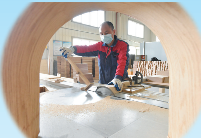
文安县李庄农场河北优曲家具有限公司工人正在生产车间有序作业。