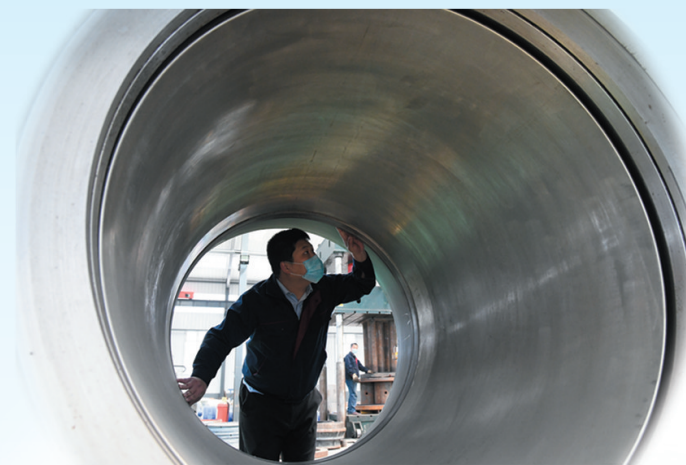
文安经济开发区泽浥公司生产车间内,工人正在检查焊接球质量。