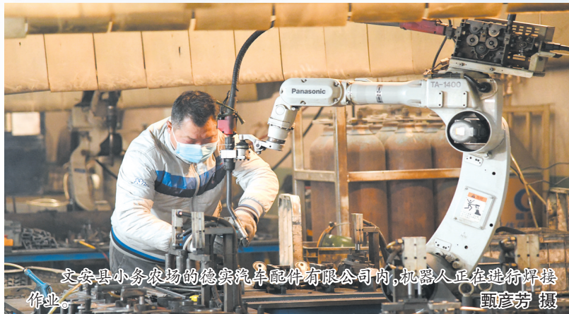
文安县小务农场的德实汽车配件有限公司内,机器人正在进行焊接作业。

根据疫情防控期间企业复工面临的问题和困难,该县及时下发了《关于切实保障企业职工返岗复工的紧急通知》等相关文件,确保企业职工迅速返岗,原材料、产品运输顺畅。对涉及域外员工返岗、原材料、产品运输等问