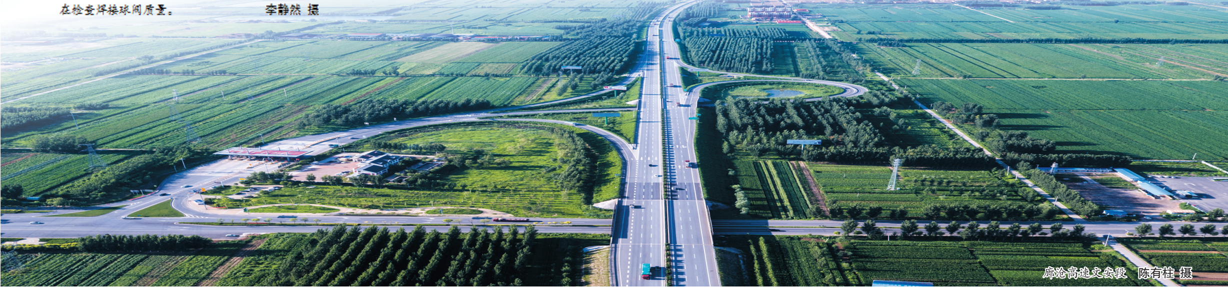
廊沧高速文安段