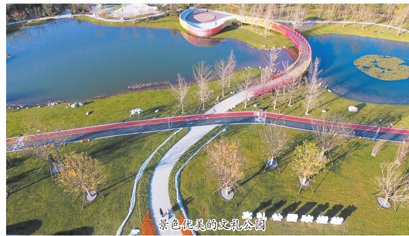
景色优美的文礼公园。

截至目前,廊坊贺阳高级中学建设工程项目、普文智慧物流园项目、年产12万吨新材料应用塑料管材管道项目等20个项目已签约;新华新城项目、智慧城市5G信号网络基站共享建设项目、廊坊市危险废物处置中心项目和新型建材项目、智慧农业产业扶