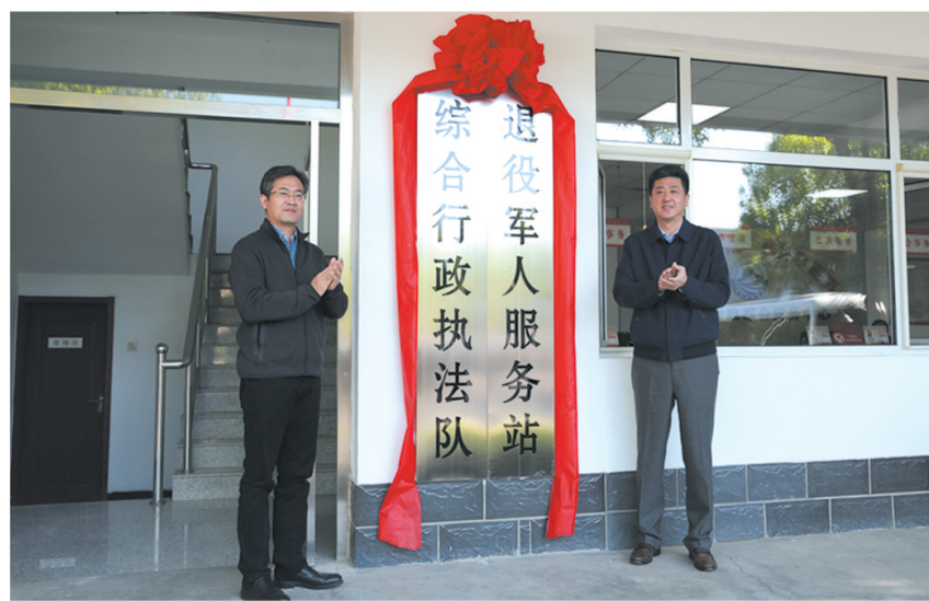
高碑店市委书记侯晓平(左),市委副书记、市长邱强为改革试点镇揭牌