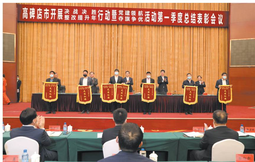
表彰先进,激励后进,高碑店市迅速掀起“比学赶超”的热潮