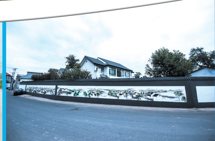
乡村振兴让高碑店农村旧貌换新颜