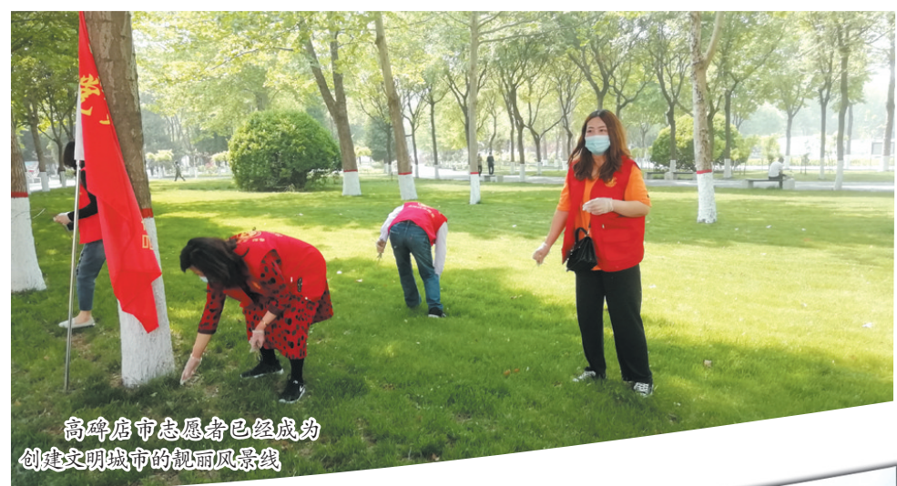
高碑店市志愿者已经成为创建文明城市的靓丽风景线