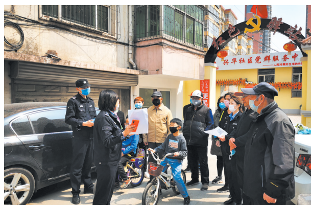
高碑店市以警民微信群为抓手,打造系列枫桥式派出所