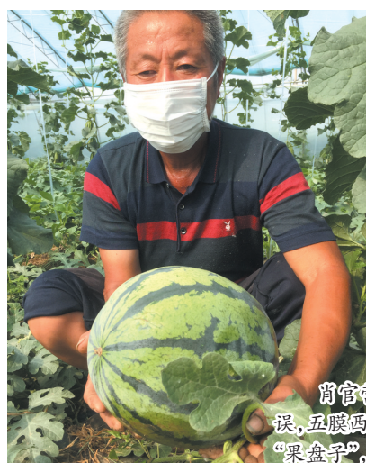
肖官营镇防疫和生产两不误,五腹西瓜上市,丰富了市民“果盘子”,鼓了农民钱袋子