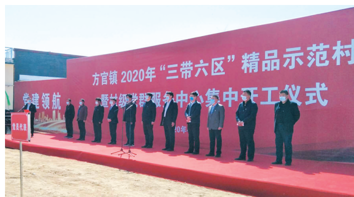
村级党群服务中心集中开工仪式