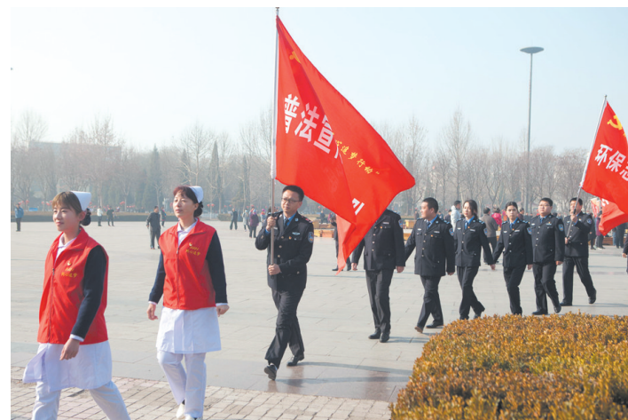
法治高碑店建设稳步推进,普法用法深入人心