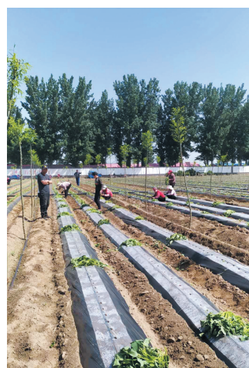
辛桥镇大力发展生态林地建设