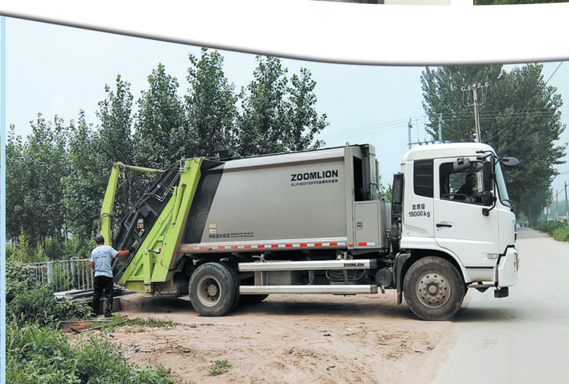
高碑店市农村垃圾处理实现了集约化,为建设美丽乡村助力