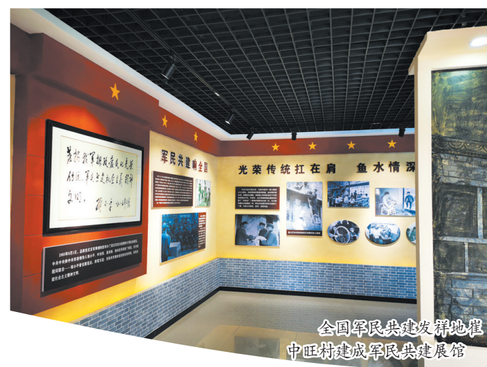
全国军民共建发展地 中旺村建成军民共建展馆