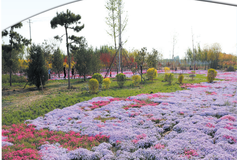
高碑店市西外环花海,成为和平街道的旅游亮点景观