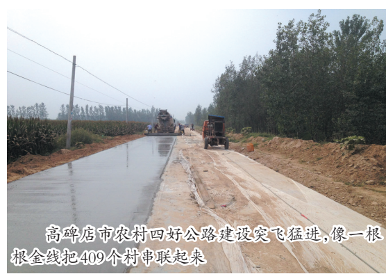
高碑店市农村四好公路建设突飞猛进,像一根根金线把409个村串联起来