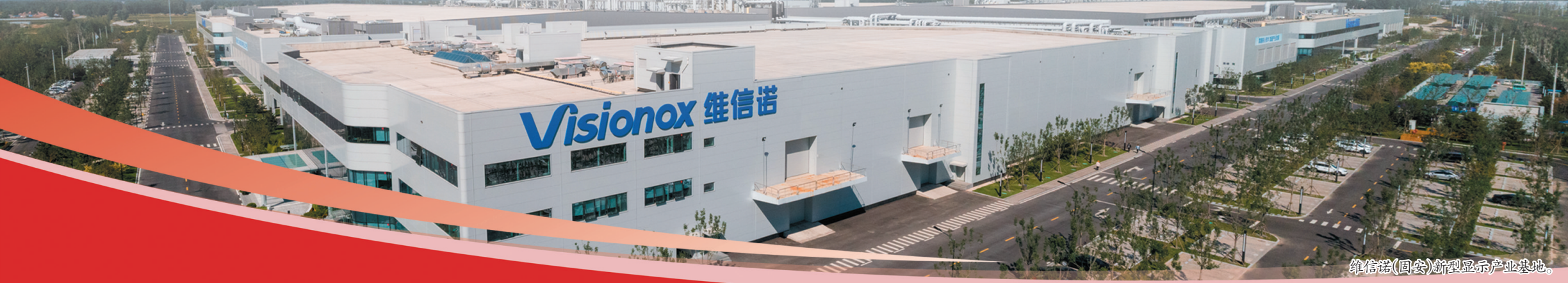
维信诺(固安)新型显示产业基地。

长风破浪会有时。站在新的起点上，固安正奋力把区位优势、交通优势、资源优势等转化为发展优势、产业优势、项目优势，用大项目、好项目的落地生根，厚植起赶超跨越的更强后劲。