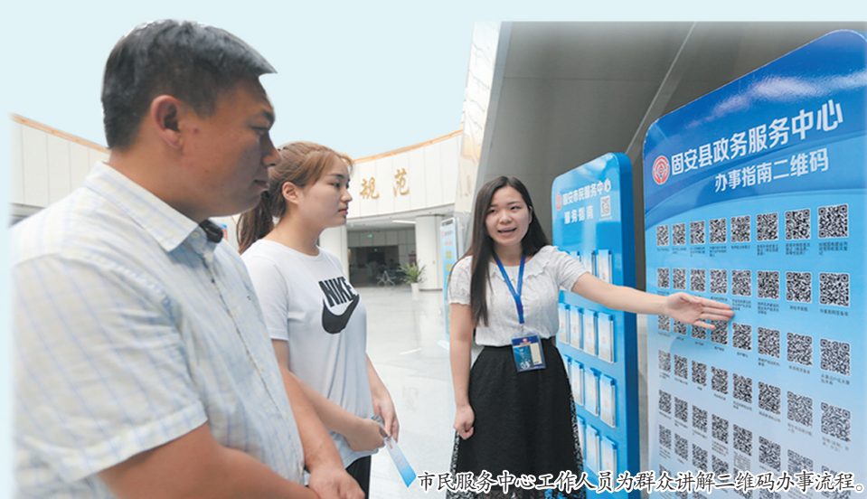
市民服务中心工作人员为群众讲解二维码办事流程。

受新冠肺炎疫情影响，企业资金链、供应链紧张，市场交易活跃度下降，企业经营进入多重困难叠加期。固安全面摸排并解决企业发展过程中的问题和困难，开展“聚芯”行动，从政策、资源、专业服务等多方面综合发力，针对具体问题，剖析难点障碍，谋划对策举措，助力企业发展。相继出台了覆盖综合政策、产业政策、科技人才政策、金融政策的18条营商服务优惠扶持政策，研究出台了“暖企十条”、组织“抗疫情、促发展”银企对接会、开展春风行动暨就业援助月现场招聘会、对于全县的重点企业派出242个驻企帮扶组实时指导企业日常工作等一系列举措，“硬核”政策为企业经营按下了“快进键”。