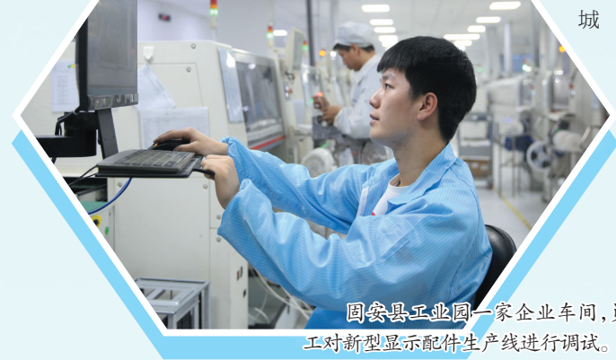
固安县工业园一家企业车间，员工对新型显示配件生产线进行调试。

建设以新型显示、航空航天、生物医药为主导，以智能网联汽车为先导，以临空服务、文体康养、都市农业为特色的313现代产业体系。力争全年引入亿元以上产业类项目30个以上，新开工亿元以上产业类项目20个以上；乡镇签约500万元以上项目30个，新开工15个；市、省、市重点项目25个；列入省、市、县重点项目7个，实施技改项目35个。进一步形成洽谈储备一