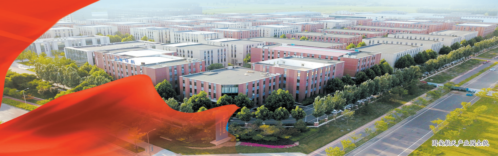
固安航空产业园全景

当前，固安坚持把发展作为第一要务，紧抓二季度窗口期，以“三创四建”“项目建设年”“服务企业年”为契机，持续优化营商环境，出台工业用地二次利用政策，强力推进征地拆迁和手续办理攻坚战，全力推动“容缺审批”“绿色通道”等超常规措施落地实施，不断强服务、解难题、抢进度、赶时间，努力实现“双过半”，确保高质量完成全年目标任务。