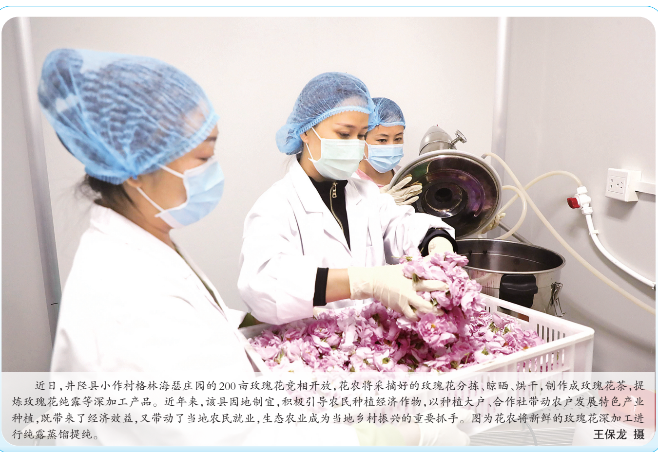
近日,井陘县小作村格林海庄园的200亩玫瑰花竞相开放,花农将采摘好的玫瑰花分拣、晾晒、烘干,制作成玫瑰花茶,提炼玫瑰纯露等深加工产品。近年来,该县因地制宜,积极引导农民种植经济作物,以种植大户、合作社带动农户发展特色产业种植,既带来了经济效益,又带动了当地农民就业,生态农业成为当地乡村振兴的重要抓手。图为花农将新鲜的玫瑰花深加工进行纯露蒸馏提纯。