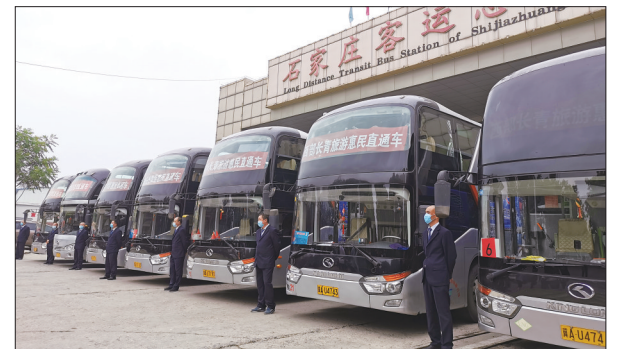
日前,石家庄石运集团推出西部长青惠民旅游直通车,市民从石家庄坐车可直达景区。去年以来,该集团陆续推出了11条旅游线路直通车。图为惠民旅游直通车整装待发。

按照“把农业做成产业化”的要求,该村充分利用自身优势,通过资源整合,模式创新,村企联合,开发农业规模化种植,标准化生产,建成塔元庄农业科技生态示范园。园区占地150亩,共有28个大棚,所种植的黄瓜、西红柿等全部采用无土有机基质栽培技术,口感好,产量高。