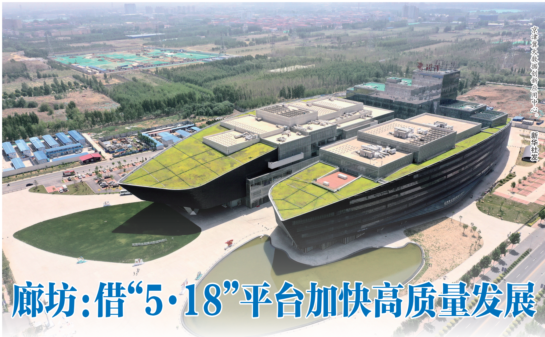
京津冀大数据创新应用中心