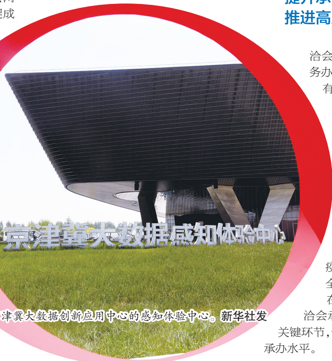
京津冀大数据感知体验中心

突出形象展示,紧密结合争创全国文明城市,进一步提升环境绿、美、净、亮水平,全面展示城市建设成果和对外开放形象;突出组织领导,层层压实责任,注重统筹协调,加大宣传力度,形成了全市上下齐心协力办好“5·18”的强大合力。