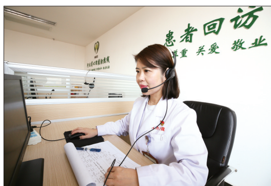
位于保定市的省精神卫生中心日前开通“中高考阳光减压热线”,为保定考生和家长提供免费的线上心理咨询服务,帮助考生缓解不良情绪,积极应对中高考。