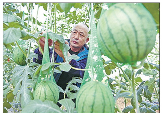
今年,永清县后奕镇韩各庄村紧盯京津市场需求,采取“合作社+农户”的方式,组织带动全村150余户村民种植麒麟瓜400余亩,预计年销售收入可达400余万元,有力促进村民增收。图为在该村益群种植农民专业合作社大棚内,村民正在管理麒麟瓜。

本报讯(通讯员吕海涛)近日,文安县公安局积极开展精准扶贫入户帮扶工作。走访中,帮扶民警逐户走进帮扶对象家中,详细了解各贫困户目前的家庭人口、经济收入、劳动能力、孩子教育、医疗保险、养殖种植、致贫原因和脱贫意愿等情况,填写建档立卡贫困户入户调查表和建档立卡贫困户帮扶联系卡,力所能及地帮助解决帮扶户生产生活中存在的实际问题和困难,并为帮扶户送去了米、油等生活用品。