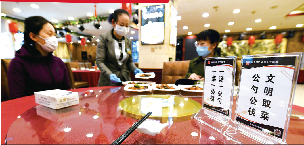
日前,安次区开展了“公勺公筷 文明用餐”行动,倡导文明用餐理念,养成健康就餐习惯,助力“舌尖抗疫”。图为花果山美食餐厅工作人员为客人分餐。

在完善现场业务服务的同时,该县还积极开辟网上办理路径,实现了网上查询、网上申报、网上审批,并积极探索线上线下相结合的办理模式,让数据多跑腿,让群众少跑腿,真正解决了服务群众“最后一公里”问题。