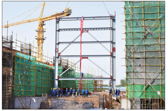
三河市生活垃圾焚烧发电厂项目采用政府和社会资本合作模式,总投资14.1亿元,设计日处理规模2000吨,年处理生活垃圾73万吨,年发电量4亿度。图为该项目锅炉第一根钢架开始吊装。

“让森林走进城市,让城市拥抱森林。”日益良好的生态环境让廊坊市民切实享受到了创建国家森林城市的成果。百姓的幸福、自豪感油然而生。