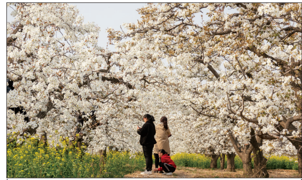
梨花飞雪四月天，万亩一色天际边。近日，赵县25万亩梨花竞相绽放，引来众多游人驻足其间赏花观景。图为游客观赏盛开的梨花。

正在进行菊花、板蓝根等中药材扩种；在张家峪、王家岩等村，正在对去年种植的千亩花椒进行管护，新打机井2眼，松地复耕，计划套种优质谷子、红薯、豆类等小杂粮，实现种植多元化和多重收益保障……据介绍，今年，南峪镇谋划了农业产业化项目27个，涉及花椒、菊花、桃树、薯类、水稻、谷物等种植项目以及农产品加工项目。当前，春和景明，万物复苏，该镇到处都是全力抢抓农时做好春耕备耕的劳作场景。