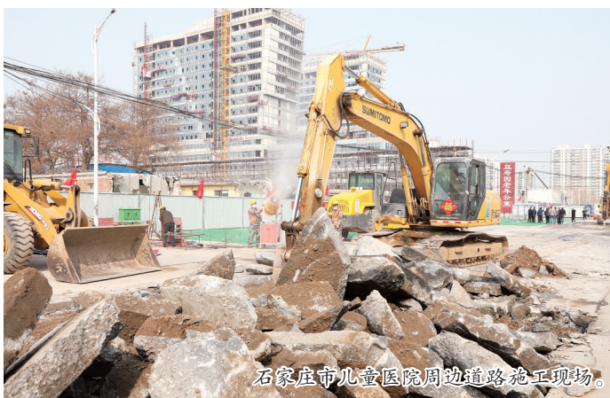
石家庄儿童医院周边道路施工现场。

“企业遇到的堵点、难点、痛点就是我们要解决的重点。”石家庄市行政审批局副局长刘然表示，将千方百计为企业复工复产疏堵点、解难点、去痛点，推动企业全面复工复产，努力将疫情对经济的影响降到最低。下一阶段，该局还将优化审批流程，提升办事效率，助推企业早复工、早复产，早开工、早达产。