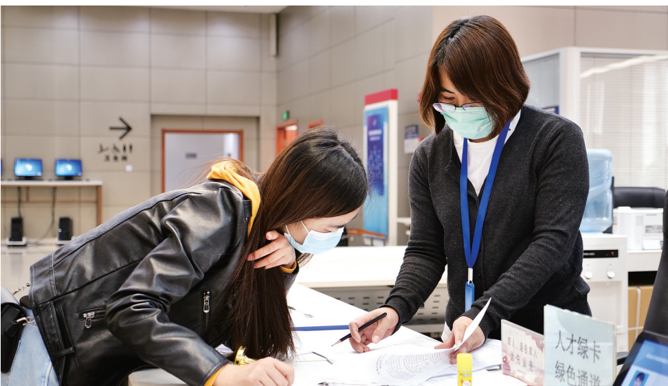
工作人员正在讲解办理流程及相关政策。

在友谊大街与汇丰路交叉口西北角，石家庄市儿童医院项目工程正在紧张施工。市儿童医院周边道路属石家庄市2020年重点民生工程，石家庄市城投集团承担其中4条道路的建设任务。