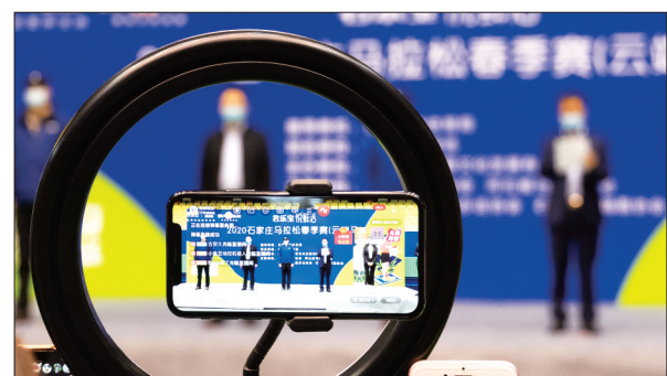
4月12日上午，2020石家庄马拉松春季赛(云端马)线上开幕式在河北体育馆举办。活动报名开启以来，仅1周时间就有超过2.3万人参加。图为2020石家庄马拉松春季赛(云端马)线上开幕式。