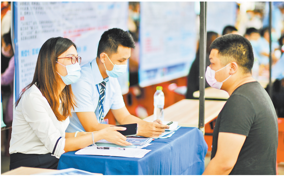
四月十八日,用人单位与求职者现场交流。

日,人社部百日千万网络招聘专项行动启动,截至4月9日,124万家用人单位发布岗位1162万个。