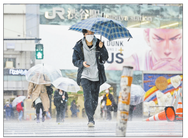
4月18日,在日本东京,行人戴口罩走在涩谷街头。据日本广播协会(NHK)电视台的统计,截至18日17时35分(北京时间16时35分),日本当日新增确诊病例255例,累计确诊10104例;累计死亡290例。