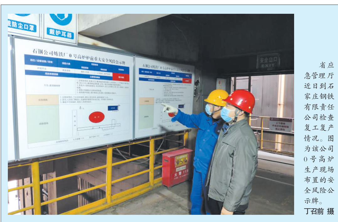
省应急管理厅近日到石家庄钢铁有限责任公司检查复工复产情况。图为该公司0号高炉生产现场布置的安全风险公示牌。

查、现场核查情况及其它方面相关情况,出具创建指导意见书。对于不予出具创建指导意见书的,书面反馈企业具体问题,企业整改完成后再出具创建指导意见书。 《细则》规定,二级标准化评审过程中,省应急管理厅将委派监管人员或者专业人员担任现场评审员,独立开展评审工作。申请创建的企业通过评审后,省应急管理厅将对评审报告和评审组织单位的审查意见书进行审核,审核通过的予以公告,并按照《办法》有关规定组织对二级标准化达标企业现场评审工作进行抽查。 《细则》要求,企业上报的标准化运行安全管理制度文件存在内容形式化、模板化,内容与企业实际情况不对应,未结合企业实际情况编制制度文件,安全风险管控措施出现标准规范引用错误等问题的,终止企业标准化创建工作,1年后方可重新申请创建。同时,对提供标准化咨询服务的第三方机构进行处理,并约谈其主要负责人。