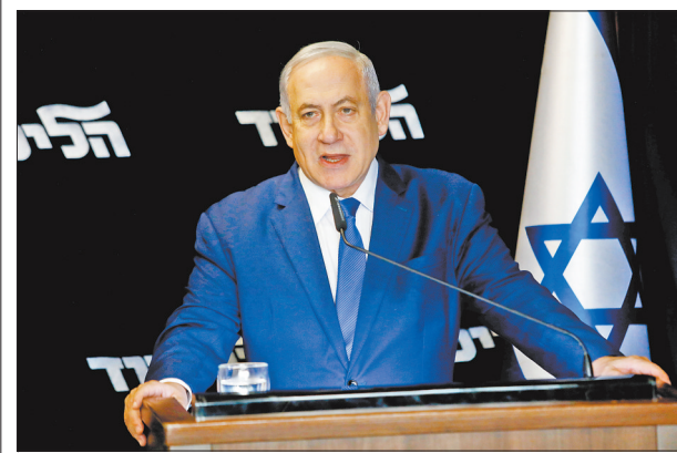
12月27日,在以色列特拉维夫附近,内塔尼亚胡在赢得选举后发表讲话。在26日举行的以色列利库德党首选中,现任利库德集团主席内塔尼亚胡击败竞争对手再次当选主席。他将再次领导利库德参加下届议会选举。27日凌晨公布的正式选举结果显示,内塔尼亚胡获得72.5%的选票,而其竞争对手吉德翁·萨尔获得27.5%的选票。