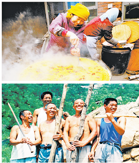
农民组照