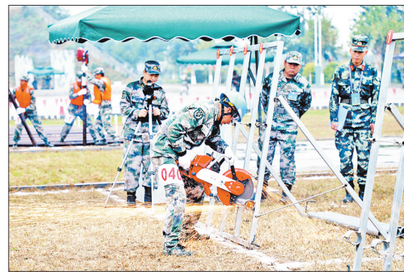
10月16日,河北省军区组织全省民兵分队群众性练兵比武活动,来自11个军分区(警备区)的264名民兵围绕共同基础课目、专业课目、应急行动课目展开角逐。