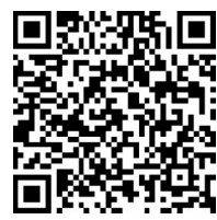
扫描二维码 上网看详情

近日,保定市公安局通过官方微信、微博发布了一段名为《我们》的视频,记录下了公安民警、辅警和家属默默付出的点滴生活,并以此致敬这些共同守护着城市的“我们”。