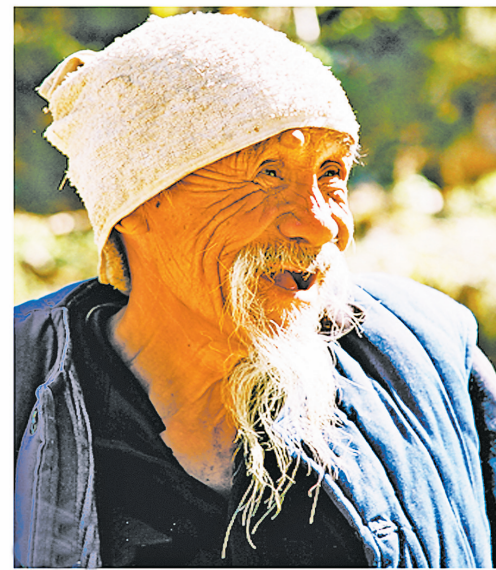
农民组照

2018年，平山全县财政收入、一般公共预算收入分别突破40亿元、17亿元大关，连续6年实现稳定增长，老区平山实现了“从向国家要补贴到给国家作贡献”的跨越转变。在卢白子的图片中，岗南水库、西柏坡发电厂、敬业集团、驼梁、