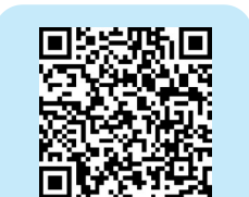
扫描二维码 上网看详情

山村之一，近年来通过发展旅游和果树产业，年人均收入已经从1992年的不足200元到如今的4000元，跨出脱贫行列。卢白子常年跟拍这个村，记录下了赵家沟从穷山村到市级美丽乡村的全过程。