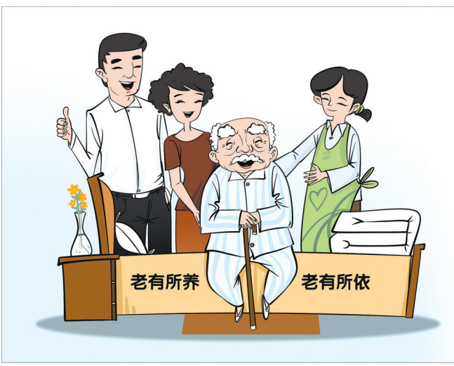
幸福晚年 曹一作

一是多方联动“促普惠”。一方面,广大人民群众对于价格合理、方便可及的养老服务需求旺盛;一方面,对于企业而言,养老服务投资大、回收周期