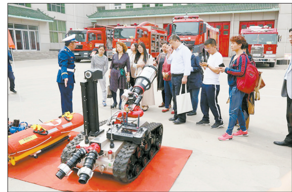
5月8日上午,“新时代的火焰蓝”河北知名作家进消防采风创作活动启动仪式在石家庄市消防支队特勤二中队隆重举行。据悉,本次采风创作活动为期50天,有21名优秀河北青年作家参与,活动期间,作家们将与一线消防指战员一起工作、生活。