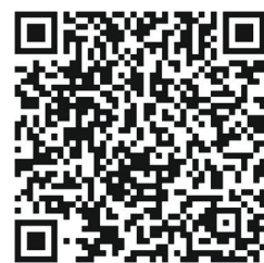
扫描二维码 上网看详情

5月10日上午10时,长城新媒体集团特别邀请到省人社厅社保局局长、分党组书记李青海,省医保局党组成员、副局长张均,省人社厅养老保险处处长赵华,做客“网民问政”访谈直播间,就我省城镇职工基本养老保险单位缴费、社保缴费基数调整等问题与网友进行交流。