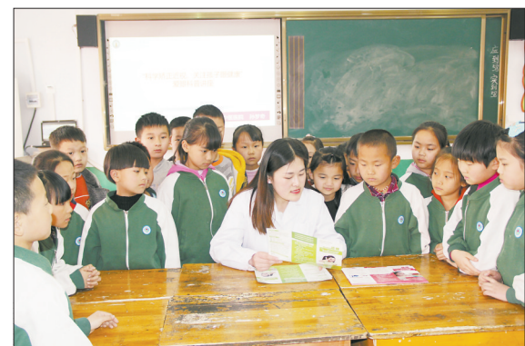
近日,临城县实验小学邀请该县中医院眼科医生走进校园,为学生们进行眼部健康检查,讲解爱眼护眼知识,引导孩子们从小养成爱护眼睛的好习惯。