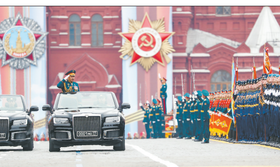
5月9日,在俄罗斯莫斯科举行的胜利日阅兵式上,俄罗斯国防部长绍伊古乘坐检阅车检阅部队。为庆祝卫国战争胜利74周年,俄罗斯首都莫斯科5月9日举行盛大阅兵式。