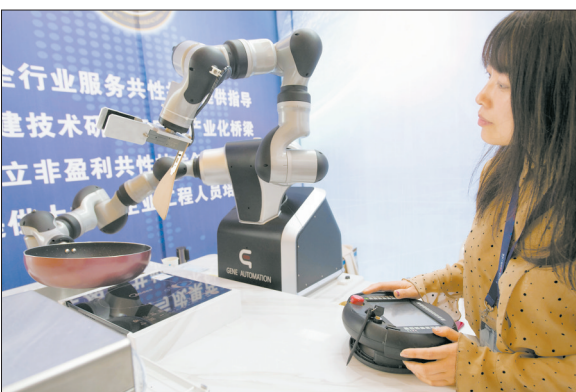
5月9日,在浙江余姚举行的第六届中国机器人峰会现场,展商展示一款做饭机器人。当日,以“机器智联、赋能万物”为主题的第六届中国机器人峰会在浙江宁波余姚开幕。