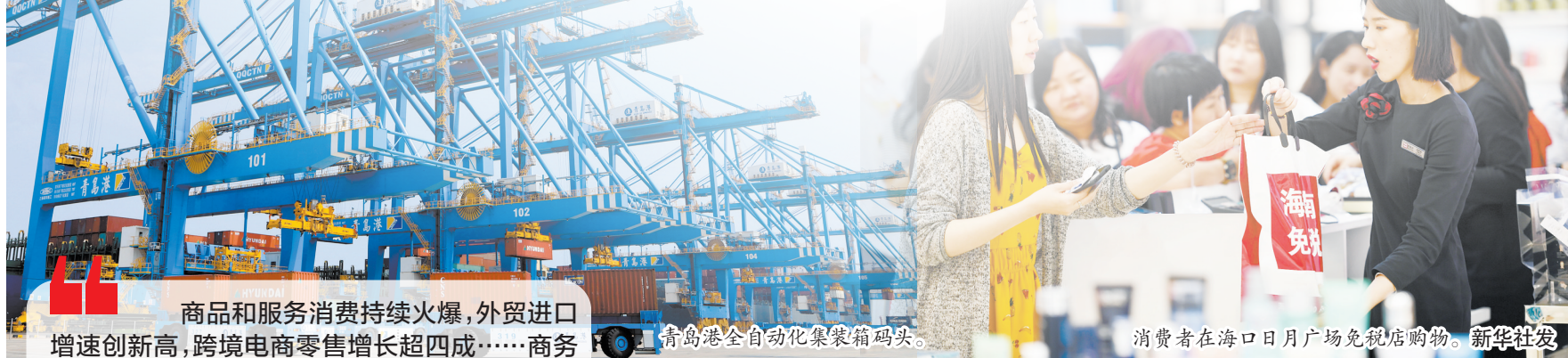
商品和服务消费持续火爆,外贸进口增速创新高,跨境电商零售增长超四成……商务部9日发布的内外需数据中,进一步释放出经济发展的活力与动力。