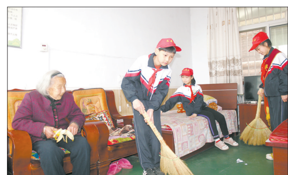
近日,临城县第一小学的学生志愿者们利用假期来到该县敬老院,为老人们打扫卫生、表演节目,进一步弘扬了中华民族尊老敬老的传统美德,倡导了“奉献、友爱、互助”的志愿服务精神。