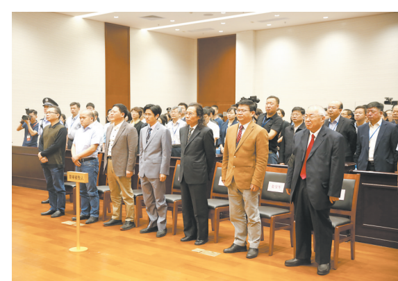
4月10日,最高人民法院对原审被告人顾维军等人虚报注册资本,违规披露、不披露重要信息,挪用资金再一案进行公开宣判。

最高人民法院10日公开宣判原审被告顾维军等人虚报注册资本,违规披露、不披露重要信息,挪用资金再一案,撤销了原判对顾维军的部分罪名量刑,部分原审被告人被宣告无罪。 作为一起始于十多年前的涉产权疑难复杂案件,顾维军案再受到社会各界高度关注。法律界人士普遍认为,该案的再审改判释放了产权司法保护的积极信号,对于激发企业家创新创业动力、促进经济社会持续健康发展意义重大。