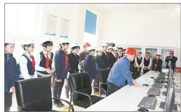
近日,石外集团七年级10班全体学生来到三峡新能源平山发电有限公司白鹿光伏电站,参观调研光伏发电项目。通过此次实践活动,同学们纷纷表示,一定要养成节能习惯,减少用电,从而减少煤炭消耗,用实际行动保卫碧水蓝天。