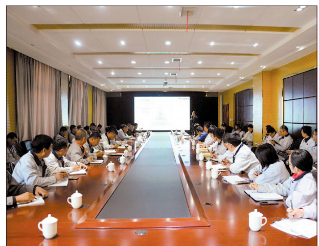
3月23日,联众集团组织召开了“赶考日”专题学习讨论活动,旨在把“赶考”精神转化为推动工作的动力,促进集团各项工作再上新台阶。

对接会现场,西安高校的领导和专家介绍了他们在材料科学、3D打印、网络通信等领域取得的最新成果。双方表示,希望在互相交流中挖掘合作发展的机会,最终形成两地产学研协同发展的良好局面。