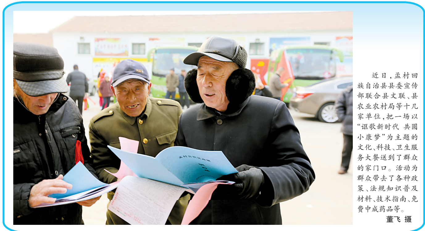
近日,孟村回族自治县县委宣传部联合县文联、县农业农村局等十几家单位,把一场以“讴歌新时代 共圆小康梦”为主题的文化、科技、卫生服务大餐送到了群众的家门口。活动为群众带去了各种政策、法规知识普及材料、技术指南、免费中成药品等。

该公司组织人员分赴深入辖区企业客户,全面了解客户生产经营、用电负荷及用电需求等情况,现场为企业制订科学合理的用电方案,并悉心听取客户对供电服务和供电质量的意见和建议;开辟绿色通道,对办理暂停手续的客户快速进行复电,对企业提出的业扩增容等用电申请,简化报装流程,及时满足企业增容等用电需求,获得了用户的好评。