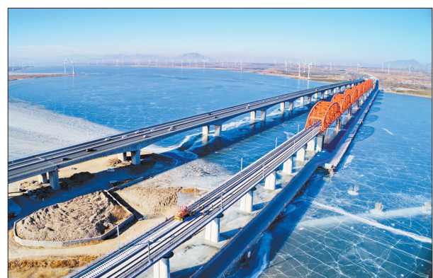
1月13日,中铁三局的工人在京张高铁官厅水库特大桥进行铺轨作业(无人机拍摄)。当日,京张高铁官厅水库特大桥铺轨工作完成。