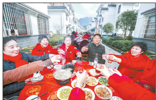
1月13日,游客在莲花镇戴家村的长街宴上品当地乡土特色美食。当日,浙江省建德市莲花镇举办乡村民俗文化节,吸引各地游客。