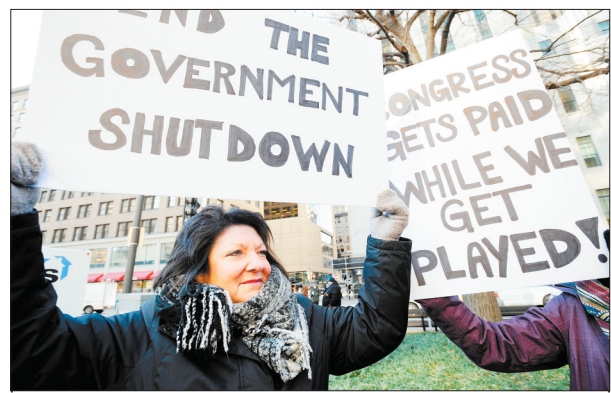
1月11日,在美国波士顿,受影响的居民抗议美国联邦政府部分机构“停摆”。美国东部时间12日零时,“停摆”进入第22天,这意味着美国联邦政府迎来史上最长“停摆”。