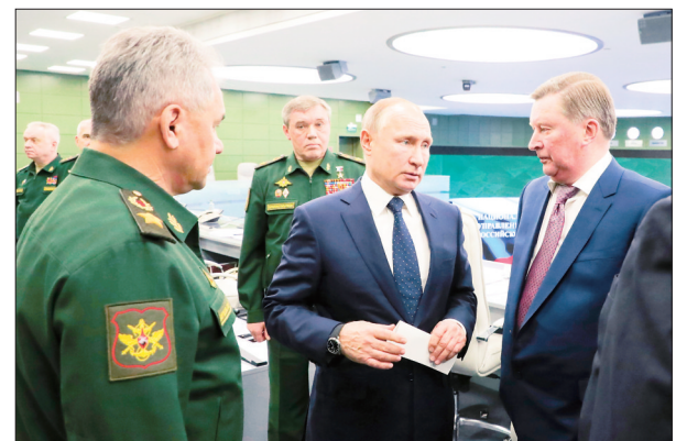
12月26日,在俄罗斯莫斯科,俄罗斯总统普京(中)、俄国防部长绍伊古(左)准备观摩导弹试射。据克里姆林宫网站26日发布的消息,俄罗斯总统普京当天在俄国防部的国家防御指挥中心,通过直播画面观摩了俄1枚“先锋”高超音速导弹试射。