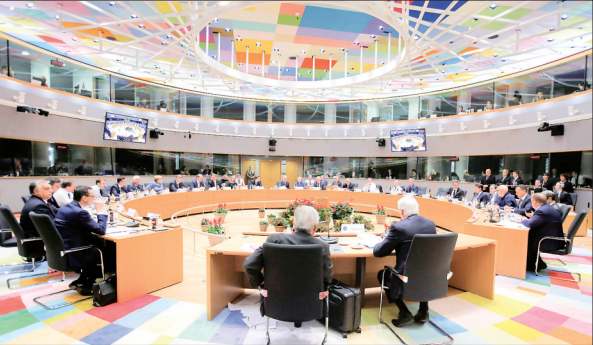
这是 11 月 25 日在比利时布鲁塞尔拍摄的欧盟特别峰会现场。欧盟成员国领导人 25 日在布鲁塞尔举行的欧盟特别峰会上正式通过此前与英国达成的“脱欧”协议。这是英国与欧盟启动“脱欧”谈判一年多以来取得的重大成果。

据新华社伦敦 11 月 24 日电(记者孙晓玲)英国牛津经济研究院近日发布报告预测,到 2035 年,中国将有四座城市跻身全球城市经济总量排行榜前十位。 报告预测,位列榜单前四名的城市将分别是纽约、东京、洛杉矶和伦敦,上海将排在第五位,北京、广州和深圳将分别排在第六、第九和第十位。 按照经济增长速度排名的榜单中,中国也有四座城市入围前十,分别为排名第五的深圳,以及第八、第九、第十的天津、上海和重庆。 报告预测,在经济增速最快城市的排行榜上,发展中国家城市将名列前茅,其中排在前四位的分别是班加罗尔、达卡、孟买和德里。