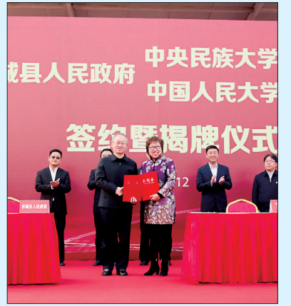
双方签署《援助办学合作协议》。