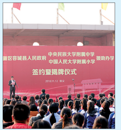
签约暨揭牌仪式现场。

府公车的使用效率,堵住了公车私用的漏洞;与交通运输部合作首创了智能ETC产品,将4G通信、手机支付与高速公路不停车收费打通,扩大了ETC的用户群,提升了高速公路的通行效率。同时,中国电信利用4G网络、云计算和人工智能,对两客一危、公交车、出租车、大货车的司机进行远程身份验证和疲劳驾驶监测,提高交通运输的安全管理水平;与深圳等城市的交警部门合作开展基于车联网的违章视频举报受理工作,与人保车险等保险企业合作,探索利用车联网改善司机的驾驶行为,降低交通事故发生的可能;同时利用车联网搜集城市交通大数据,输入智慧城市大脑,为城市交通秩序改善做出积极贡献。