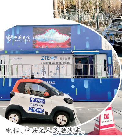
电信、中兴无人驾驶汽车。