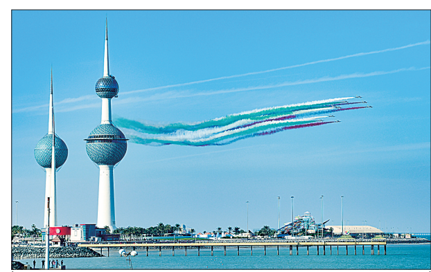
11月18日,意大利“三色箭”飞行队在科威特首都科威特城进行特技飞行表演。第三届意大利周活动当日正式开幕。