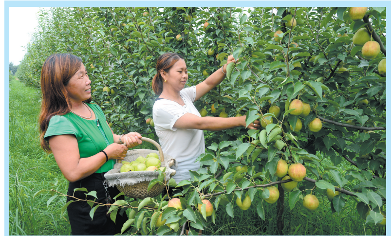
威县梨农在果园采摘梨果,丰收的喜悦溢满脸庞。

该县明确乡镇卫生院对村卫生室的管理主体责任,探索“六个统一”:一是统一产权归属。明确村卫生室归集体所有,由乡镇卫生院统一管理。二是统一人员聘任。把乡村医生作为一个职业岗位加强管理,根据农村卫生室现状和服务对象情况,统一制定人员编制计划,按照“县聘、乡管、村用”原则,出台《村卫生室医务人员聘任办法》,明确准入条件和