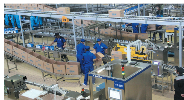
武强县蒙牛集团生产线。