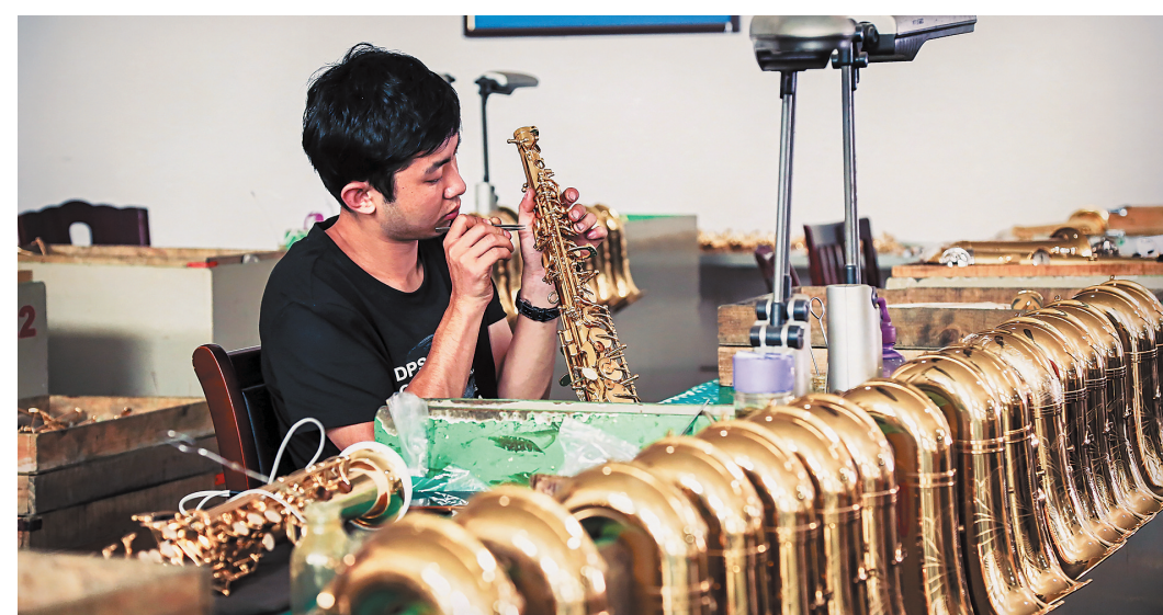
金音集团的工人正在组装萨克斯。

上,周窝音乐小镇也是下足了功夫。目前,小镇共改造了80套民宿,其中50套民居,30套是宾馆集团式民宿。