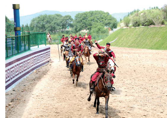
《追梦坝上草原》是木兰国际新推出的一台常态化实景演出,以顺治皇帝之女固伦淑惠公主下嫁巴林草原,从历史宏观角度推动了民族融合与文明历史进程为主题。通过震撼的马术表演、优美的舞蹈、丰富多彩的民族服饰,突出其观赏性。图为《追梦坝上草原》剧照。