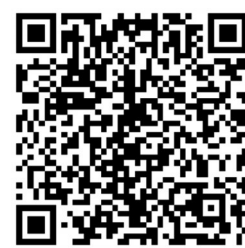
扫描二维码 上长城网查看详情

中国共产党第一次全国代表大会于1921年7月23日至31日在上海召开。出席大会的各地代表共13人。党的第一次全国代表大会正式宣告了中国共产党的诞生,中国共产党的成立是中国历史上开天辟地的大事。从此,在中国出现了一个完全崭新的、以马克思列宁主义为其行动指南的、统一的无产阶级政党。中国的无产阶级因此有了战斗的司令部,中国的劳苦大众从此有了翻身解放的希望,中国的革命从此焕然一新。 2017年10月31日,习近平总书记带领中共中央政治局常委专程赴上海,沿着早期共产党人的足迹,探寻我们党的精神密码。