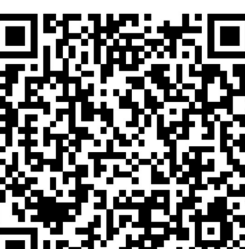
扫描二维码 上长城网查看详情

“赤日几时过,清风无处寻。”《中国天文年历》显示,北京时间7月23日5时零分,“大暑”节气将正式登场。专家提示,此时节是一年中最热的时候,公众在饮食起居上,宜多喝水常食粥,晚睡早起适当午睡,祛除暑热待秋来。