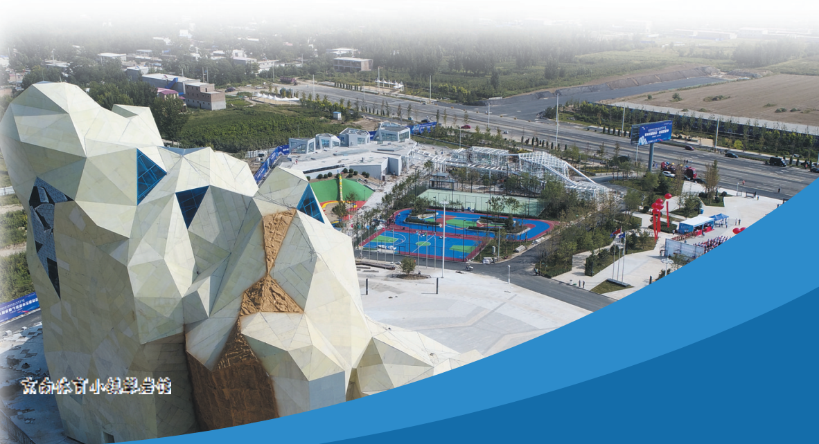
京合设计小镇门窗博览