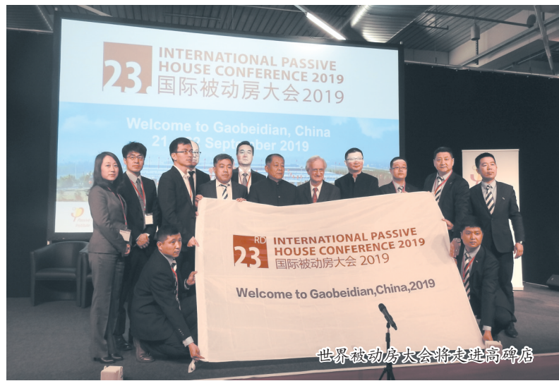
世界被动房大会将走进高碑店