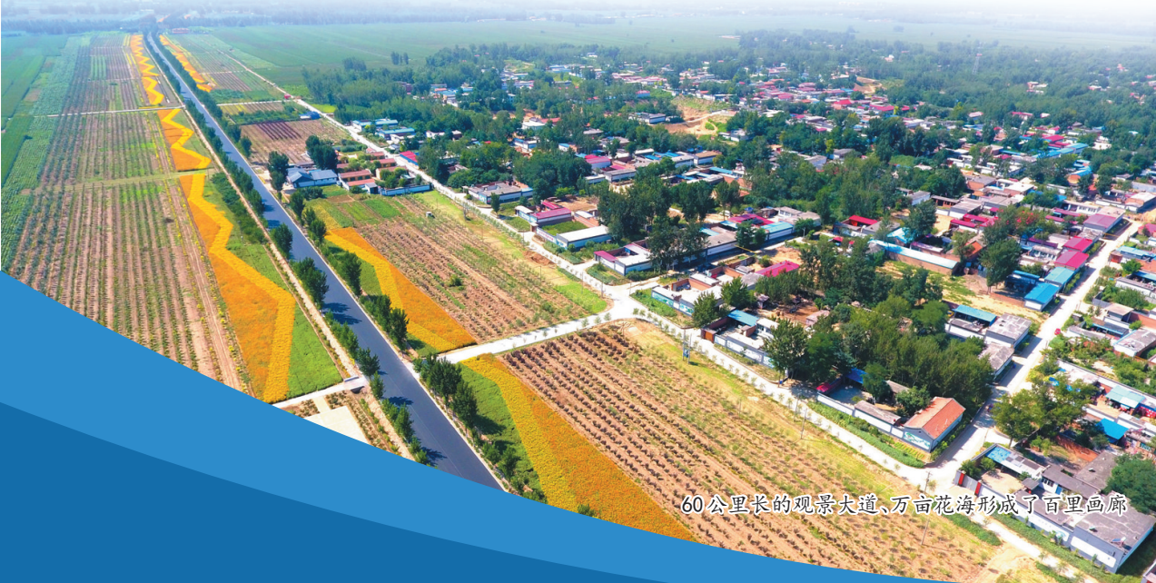
60公里长的观景大道、万亩花海形成了百里画廊