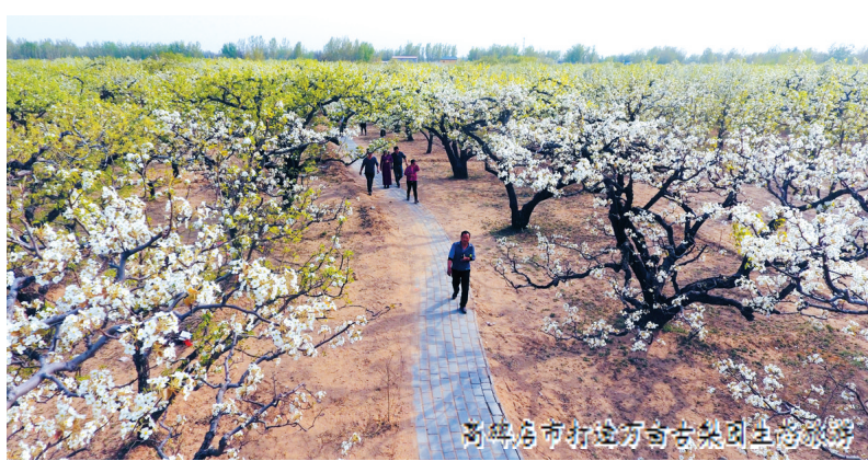
高碑店市打造万亩古枣园生态休闲

高碑店市始终坚持以习近平总书记系列重要讲话精神引领方向、武装头脑、指导实践，认真贯彻落实省委、省政府、保定市委、市政府的安排部署，在实现县域经济增比进位的同时，“三会一赛”重大活动成功举办。 高碑店市没有奇山秀水，却有国际门窗的巧夺天工，有世界特产小镇的珍馐美味，有大岩壁的雄奇峻拔，高碑店的承办工作零差错、零失误，堪称经典，充分彰显了新业态、新体验、新品牌的价值魅力。参观的嘉宾感慨，高碑店几个重大活动一起举办，每一个都很有特色，都很惊艳，而且组织严密、服务周到、群众热情。广大群众说，高碑店的环境变了，景点多了，风景美了，大变样了。保定市首届旅发大会在高碑店市的成功举办，对该市的大发展必将起到历史性的推动作用！ 总结承办“三会一赛”的经验，高碑店市打了一场漂亮的攻坚战，精品、