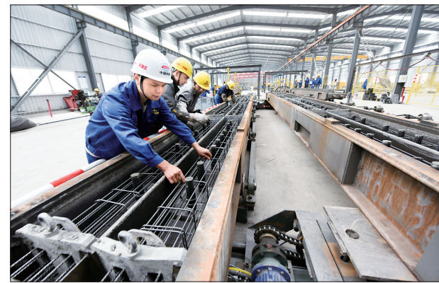
7月16日,在中铁十一局桥梁公司曲水制枕场生产车间,技术人员在进行枕木箍筋作业。承担拉林铁路全线铺轨任务的中铁十一局建设者,克服高原缺氧、施工条件复杂等困难,为9月开始的铺轨工作做准备。拉林铁路起自西藏拉萨市,终点为林芝市,铁路正线全长435公里,设计时速160公里。

(上接第一版)要带头维护民族团结,不利于民族团结的话不说,不利于民族团结的事不做,以实际行动促进各民族交往交流交融。要牢记历史使命,自觉遵守纪律,以良好作风和突出业绩展示新担当新作为。