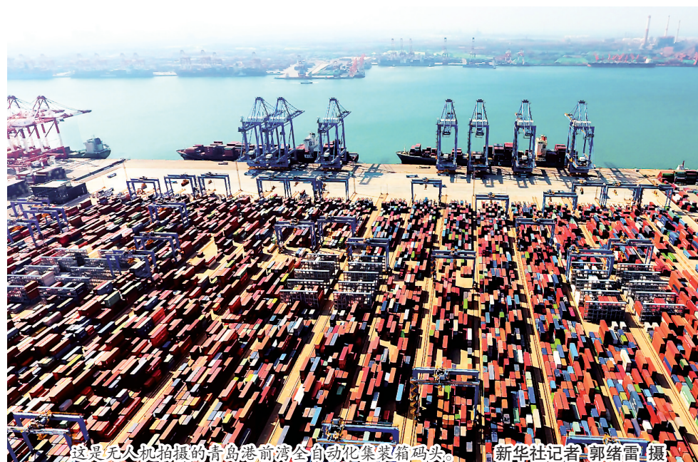
这是无人机拍摄的青岛港前湾自动化集装箱码头。

中原银行首席经济学家、中国国际经济交流中心学术委员会委员王军评价说,中国经济新旧动能接续转换,正逐渐由过去的产业链、价值链的中低端向中高端迈进,经济增长的“含金量”不断提高。