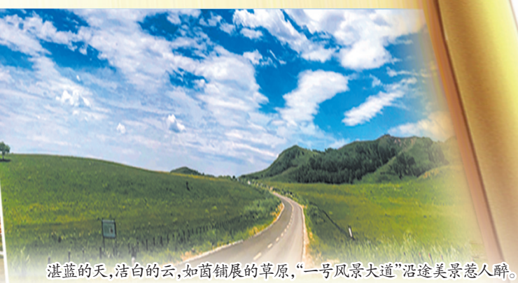
湛蓝的天，洁白的云，如茵铺展的草原，“一号风景大道”沿途美景惹人醉。

由河北省委、河北省政府主办，承德市委、承德市政府、河北省旅游发展委员会承办的第三届河北省旅游产业发展大会，于7月18日至20日在围场满族蒙古族自治县、丰宁满族自治县、御道口牧场管理区等承德坝上地区隆重召开。