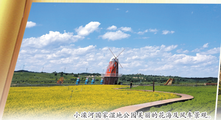
小滦河国家湿地公园美丽的花海及风车景观。