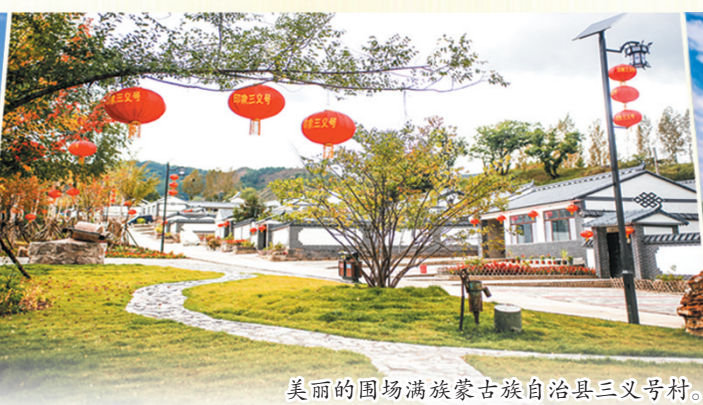
美丽的围场满族蒙古族自治县三义号村。