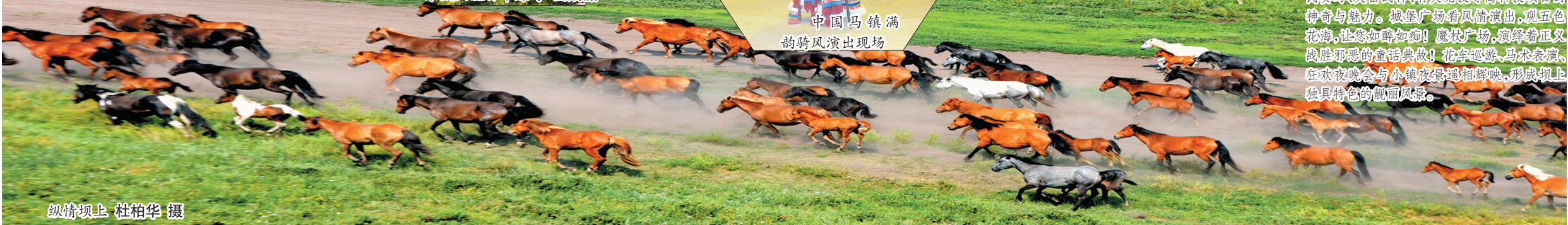
纵情坝上 杜柏华摄

在这里，您可乘上轻型飞机、动力伞、热气球遨游于蓝天白云之间，一览碧草连天的高原美景；在这里您可观精彩刺激的马术表演，亲身体验马由缰、驰骋草原的自由骑行；在这里您可与白雪公主互动，体验童话童话的美好意境，参与蓝精灵、阿拉丁神灯等童话故事互动演出；在这里您可体验钢铁侠、自控飞机、碰碰车、考拉王国等大型娱乐设备的刺激与快感，还可体验滑草、玻璃漂流、射箭等传统项目的特色与乐趣，更能体验VR、全民赛马、突击战神、有奖竞猜等高科技项目的神奇与魅力。城堡广场看风情演出，观五色花海，让您如醉如痴！魔杖广场，演绎着正义战胜邪恶的童话典故！花车巡游、马来表演、狂欢夜晚会与小镇夜场遥相呼应，形成坝上独具特色的靓丽风景。