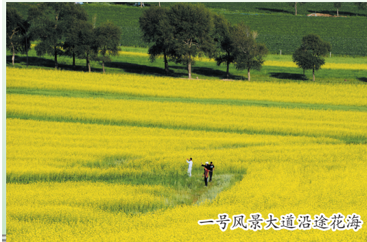
一号风景大道沿途花海

国家“一号风景大道”承德段，北起塞罕坝国家森林公园，经御道口牧场管理区、围场县，南至丰宁满族自治县大滩镇，全长180公里。国家“一号风景大道”是蒙古高原与华北平原过渡区的地理分界线，这里集聚了森林、草原、湖泊、湿地、山地等多种自然景观，一路走来，天蓝、山绿、水清，美不胜收。这条大道在丰宁境内东起外沟门，西至大滩。在过去曾是一条茶盐古道，包括通往草原、多伦的道路。1691年清代多伦会盟后，多伦商业逐渐兴盛起来，这些道路便成为京津冀直隶、山西乃至全国茶业、纺织品等物资进入多伦的通道，也是蒙盐、牲畜、皮毛、木材等进入内地的商道。从清康熙年间兴起到民国时期衰落，前后繁荣200多年。如今永太兴疏林草原、茶盐古道、天成号驿站、皇封山驿站、俄罗斯风情小镇、神仙谷七彩森林、中国马镇、大汗行宫等景区、千松坝森林公园等景区均分布在这条线路两侧。