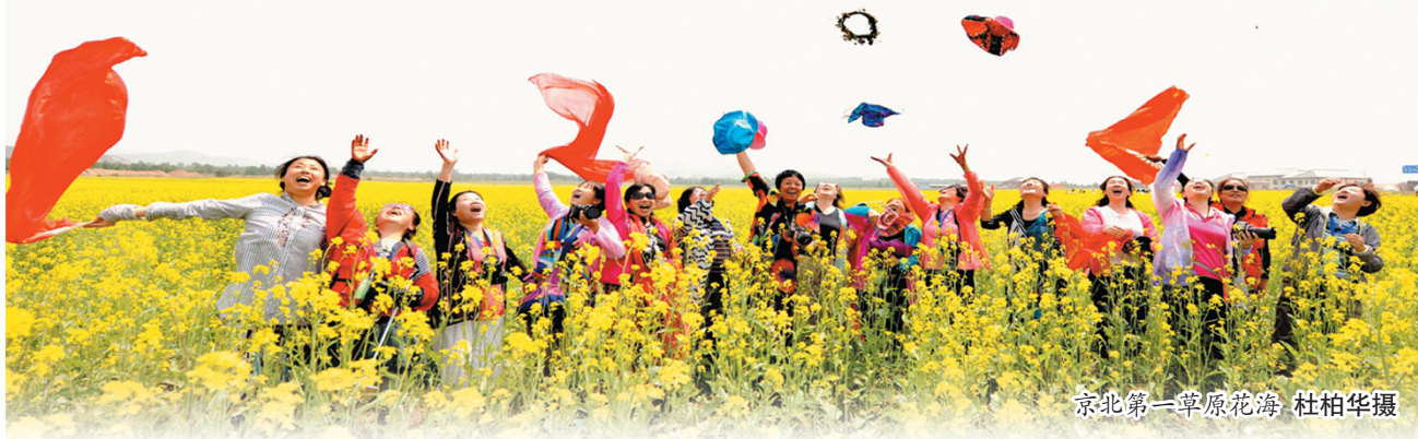
京北第一草原花海

2017年丰宁全年接待游客221万人次，实现旅游总收入12.8亿元，分别增长13%和11%。