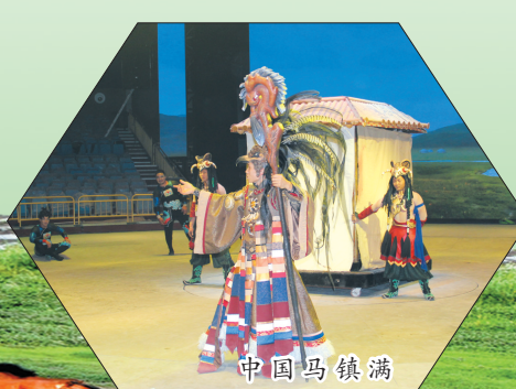
中国马镇满韵骑风演出现场

中国马镇景区位于承德市丰宁满族自治县大滩镇北部，距县城85公里，距北京城区260公里，地处坝上草原，中国马镇一期总占地面积1003.63亩，总投资12亿元人民币，中国马镇一期共分为四大主体：1.《舞马世界》主题景区；2.《满韵骑风》马戏剧；3.《烤羊美食街》；4.特色酒店群。《舞马世界》主题景区包括：内外迎宾广场、马文化展示区、马街、马帮寨子、实景马战（战神赵子龙）表演场馆、维密马秀、皇家马厩、萌宠乐园、龙马广场、主题游乐区；《满韵骑风》世界首创：以满族人文情节设计，通过杂技马戏、现代科幻舞台、多媒体等综合手段包装的马戏剧；《烤羊美食街》包括：以丰宁烤羊为主的特色烤羊展示、丰宁本地风味餐饮、游客休闲酒吧和与《满韵骑风》相配套的休闲零食等丰富业态；特色酒店集群包括：蒙古风格《白马酒店》、藏族风格《梦马酒店》、马主题《乐马酒店》。