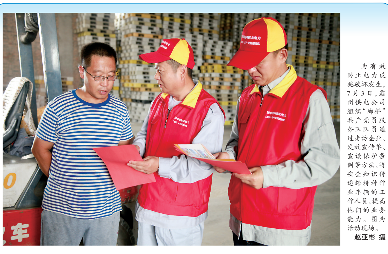
为有效防止电力设施破坏发生,7月3日,霸州供电公司组织“廊桥”共产党员服务队队员通过走访企业、发放宣传单、宣读保护条例等方法,将安全知识传递给特种作业车辆的工作人员,提高他们的业务能力。图为活动现场。赵亚彬 摄

本报讯(通讯员高顿 纪文明)夏季用电高峰来临,灵寿县供电公司全面落实度夏措施,有效应对高温大负荷。该公司推行设备“零点检修”,最大限度减少缺陷处理时间。积极引导、督促企业错峰用电,优先保障重要客户、基础设施、居民生活用电需求。认真开展巡视消缺和红外测温工作,完善事故应急预案,备好抢修物资车辆,快速应对突发事件。