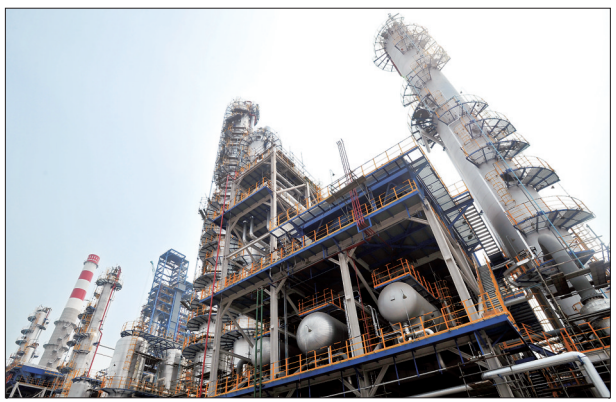
这是6月24日拍摄的华北石化千万吨炼油升级改造项目建设现场。记者从中国石化华北石化公司获悉,位于任丘市的华北石化千万吨炼油升级改造项目目前已进入攻坚收尾阶段,预计今年10月投产。

本报讯 6月24日,省委办公厅、省政府办公厅印发紧急通知,要求各地各部门做好强对流天气防范应对工作。据气象部门预报,6月25日白天到夜间,全省大部分地区有雷阵雨,其中石家庄南部、衡水、沧州东部、邢台、邯郸有中到大雨(20~40mm),局地暴雨(40~80mm),个别点有大暴雨(100~120mm),张家口南部、承德西部、保定西北部有中雨,局地大雨(10~30mm),雷雨时局地伴有短时大风、短时强降雨等强对流天气。主要降水时段集中在25日午后到夜间,最大小时雨强为20~50mm/h。为切实做好全省汛期灾害防范应对工作,省委办公厅、省政府办公厅下发紧急通知,要求做好强对流天气的防范应对工作。(下转第二版)