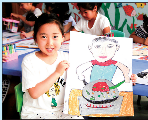
近日,唐山市丰润区迎宾路幼儿园开展“我心目中的父亲”主题绘画活动,表达对父亲的爱。