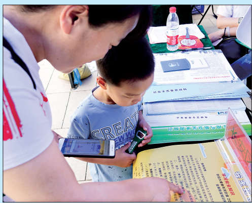
近日,我省有关部门在石家庄举行安全宣传咨询日活动。图为一位家长给孩子介绍安全知识。