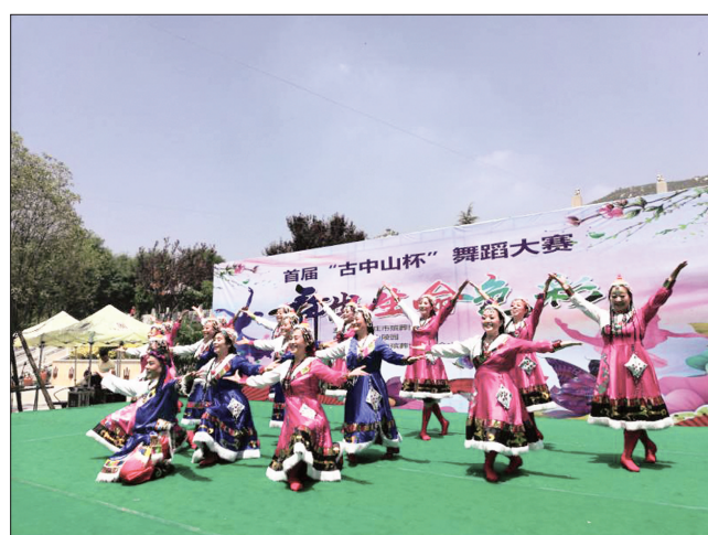
6月10日,以“舞出生命色彩”为主题的首届“古中山杯”舞蹈大赛决赛在平山举行。该赛事由石家庄市殡葬协会主办,平山县旅游协会、古中山陵园承办,旨在展示当代中老年人积极向上的精神风貌。

该县明确考核标准,将党员参加“三会一课”情况和民主评议挂钩;将“三会一课”制度落实情况作为党建工作主要考核内容,对未能正常开展“三会一课”的农村,在党建述职中扣除分值;组织规范填写农村《党支部工作手册》,并与村党支部书记、记录人员工作待遇挂钩,县委组织部随机抽查、明察暗访,以达到激励先进、教育落后的目的。