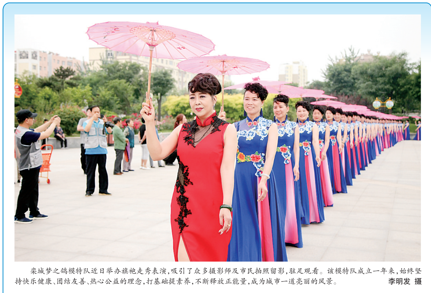
梁城梦之鸽模特队近日举办旗袍走秀表演,吸引了众多摄影及市民拍照留影,驻足观看。该模特队成立一年来,始终坚持健康快乐、团结友善、热心公益的理念,打基础提素养,不断释放正能量,成为城市一道亮丽的风景。