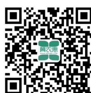
“冀农惠” 微信公众号

科技创新,研发出“冀农惠”互联网农业供应链综合服务平台,与各金融机构携手,以农业专业合作社为核心,以“地头粮”为入口,深入农村,线上线下相结合,从源头全方位打造互联网农业供应链,助力农村普惠金融的发展。