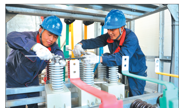
近日,邢台市供电公司员工对35千伏袁庄变电站进行扩容改造,图为供电员工对电容器组进行更换。

长城新媒体集团近日联合河北省地震局开展了“探索地震奥秘,体验地震科技”大型科普活动,邀请到省会石家庄30多名“小网友”走进地震局参观学习、了解地震常识。小学生们与地震工作者进行面对面交流,在专业人士的指导下积极体验各种救援设备的使用,并参观了地震应急物资库、地震监测网络中心、抗震救灾指挥部,直观生动的了解到地震的形成和发生过程。工作人员为地震科学常识进行生动讲解,孩子们不停的提问、记录着,本次活动使孩子们“大开眼界”。(孙向向 刘昆鹏)