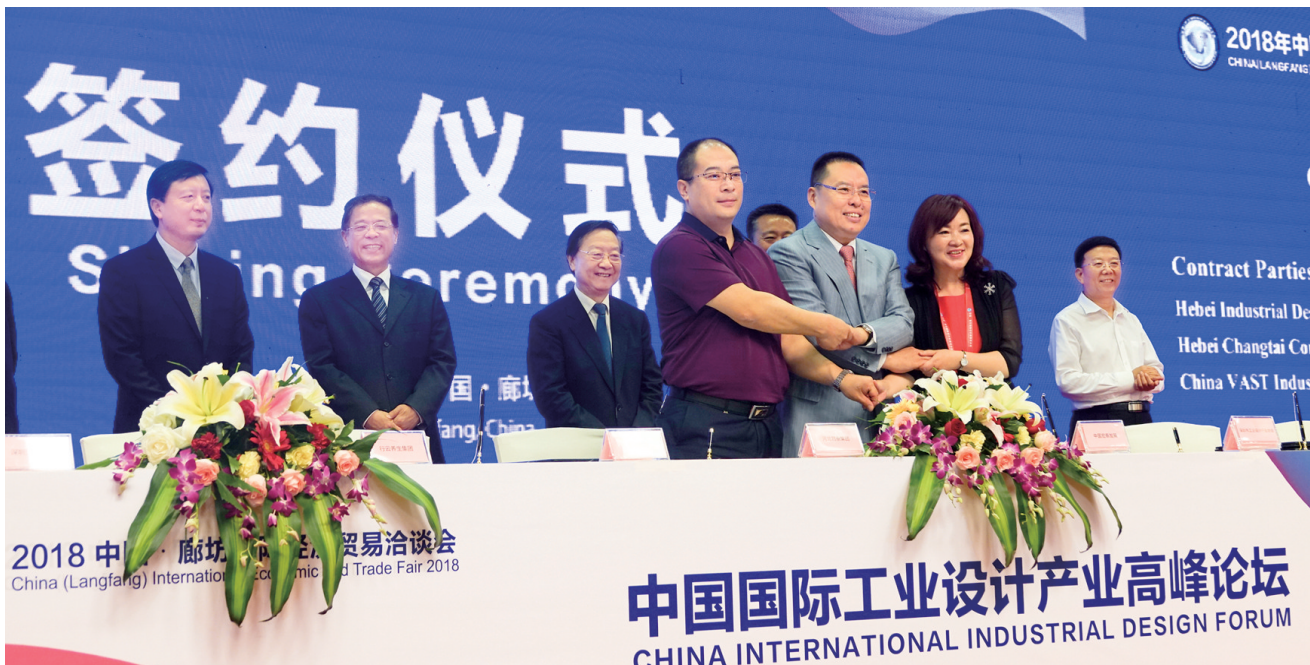
2018中国·廊坊国际经济贸易洽谈会 China (Langfang) International Economic and Trade Fair 2018 中国国际工业设计产业高峰论坛 CHINA INTERNATIONAL INDUSTRIAL DESIGN FORUM