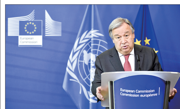
联合国秘书长古特雷斯5月16日在布鲁塞尔表示,联合国完全支持欧盟为挽救伊核问题全面协议所做的努力。古特雷斯当天访问欧盟总部。