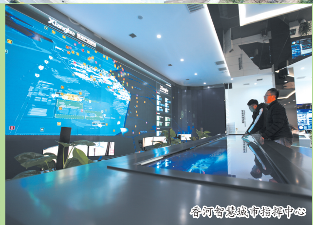
香河智慧城市指挥中心