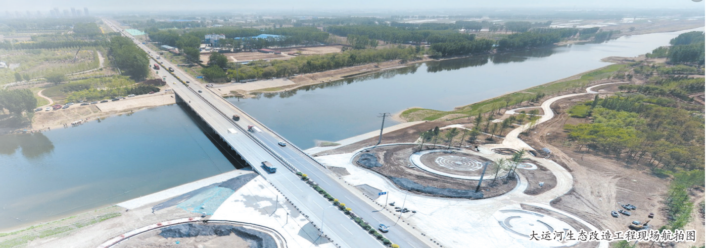
大运河生态改造工程现场航拍图

2018年是全面贯彻落实党的十九大精神的开局之年,也是香河全面建成小康社会的决胜之年、收官之年,香河县进一步科学研判形势,理清发展思路,明确前进方向,谋划确定了2018年县委工作总体思路:坚持以习近平新时代中国特色社会主义思想为统领,坚持以人民为中心,坚持新发展理念,大力实施协同发展战略和乡村振兴战略,牢牢把握创新驱动、转型升级、基层基础、绿色崛起工作主旋律,在科技创新、全域旅游、公共服务、基层党建上争一流、出亮点,整体工作上水平,全面建成小康社会,在推动高质量发展中加快建设美丽幸福新香河。工作思路的确定,为全县各项工作开好局、起好步、谋好篇奠定了坚实基础,全县上下干事创业热情高涨,发展势能不断积蓄,在推动高质量发展中加快建设美丽幸福新香河的生动局面已经打开。