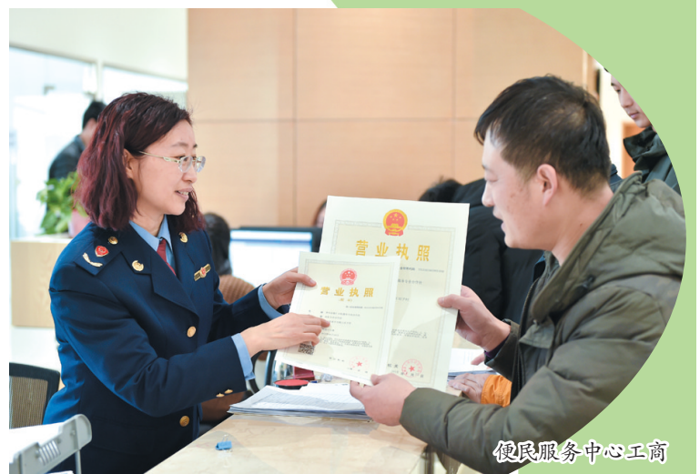
便民服务中心工商

全面从严治党为推动经济社会高质量发展提供了坚强的政治保障,香河县认真落实全面从严治党“两个责任”,特别是落实好巡视整改各项工作。制定《关于落实九届省委巡视反馈意见的整改方案》,高标准、高质量、高效率推进巡视整改落实。强化全面从严治党主动性、创新性,以巡视整改为契机,全面推进从严治党向基层延伸,在实现对村街财务审计全覆盖的基础上,全面开展了对各镇、街道、园区、县直机关等乡科级单位的财务审计,更加注重摸清资产资源底数,更加注重化解信访矛盾,更加注重运用“四种形态”,更加注重制度体制创新,及时发现问题,堵塞漏洞,健全机制,预防腐败。