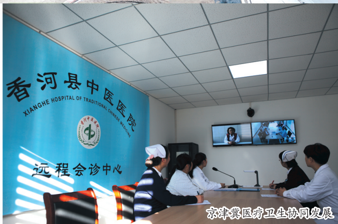
京津冀医疗卫生协同发展

在基层党建上争一流、出亮点。坚持社区党建抓示范、村街党建抓提升、非公党建抓覆盖,着力加强基层党组织创造力、凝聚力、战斗力。扎实开展后进班子集中整治“百日攻坚”行动,同步抓好村“两委”换届工作,完善村级党组织领导的村民自治机制,提升乡村治理水平。以“两考三评一定”为抓手,进一步提高农村干部绩效考核的科学化水平,增强广大农村干部责任感、主动性、执行力。