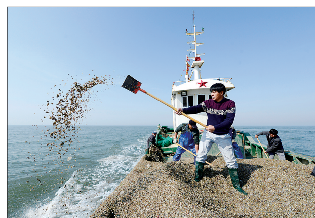
初夏时节,乐亭县沿海地区渔民抢抓农时进行海参、贝类等海水养殖产品的幼苗投播工作,为一年的丰收奠定基础。图为渔民正在进行投播作业。

本次活动由长城新媒体集团唐山记者站主办,中恒文化传媒、界外视线艺术影像承办,人民日报社市场报网络版德孝中华周刊、中国公益在线、唐山微印象、唐山综合信息服务中心协办,巴洛克形象美学空间提供形象支持。