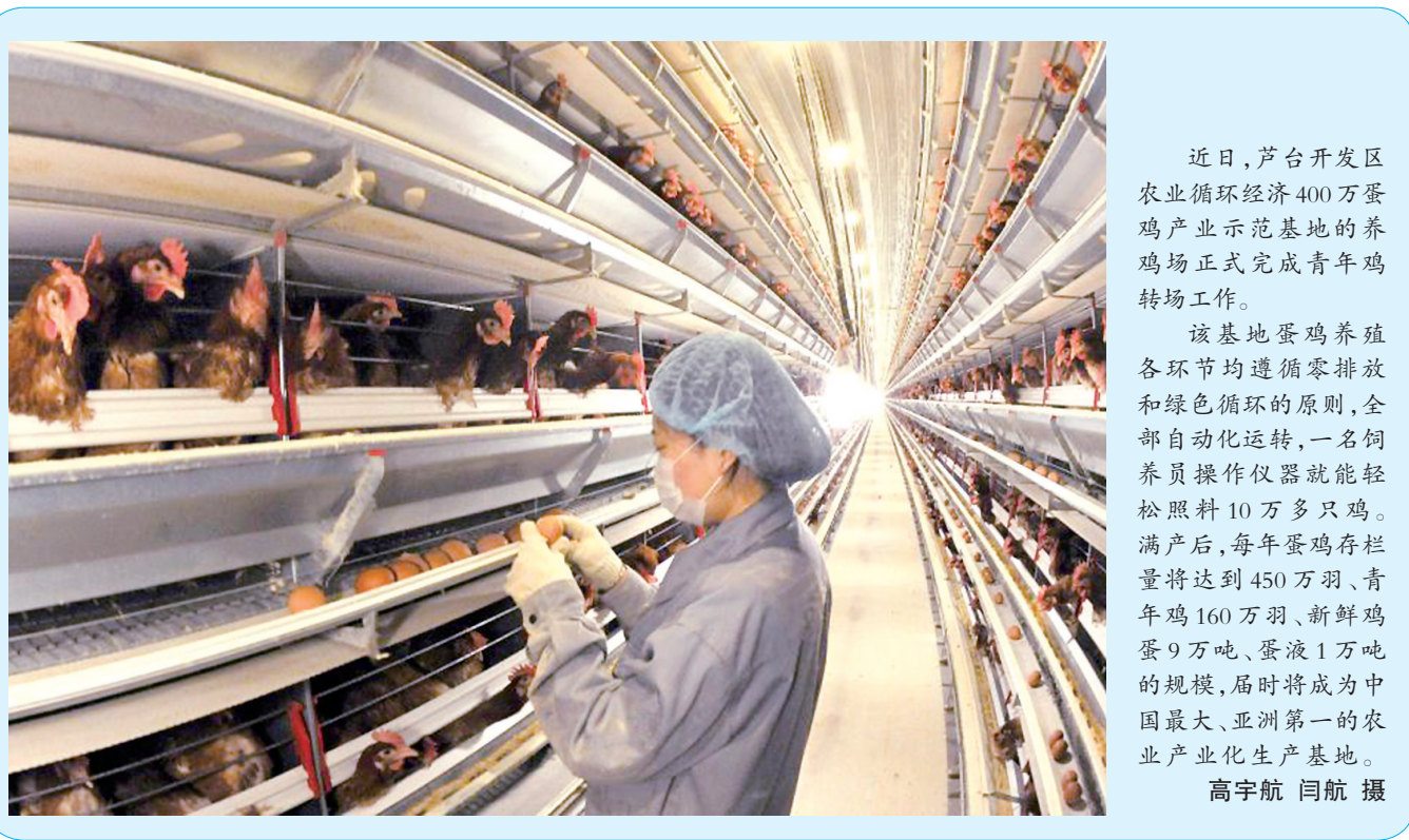
近日,芦台开发区农业循环经济400万蛋鸡产业示范基地的养鸡场正式完成青年鸡转场工作。

本报讯(通讯员徐复生 记者杜宇昕)日前,路北韩城镇东欢坨二村、三村、四村和何家庄等四个涉及压煤搬迁的村庄共2646户村民开始签订压煤村庄紧急避险补偿协议并按签订顺序领取选房顺序号,截至协议签订第一日下午,四村共签订协议121户,房屋签约套数171套,选房顺序号发放171个。