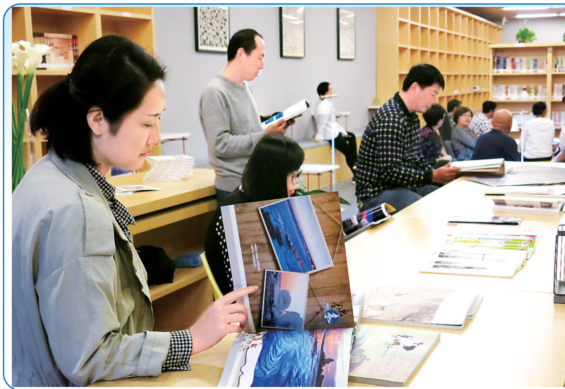
日前,北戴河区一家公益性“城市书房”开业。该区积极牵线搭桥,去年由财政投入35万元购置图书5000余册、门禁和借还系统;由秦皇岛富力城房地产开发有限公司投入300余万元购买浪淘沙艺术馆使用权,共同打造了这家“城市书房”。该书房占地面积2000平方米,位于人口密集的石塘路商业步行街,方便社区百姓和游客阅读。

北戴河民宿业始于改革开放初期,最初只有50余家家庭旅馆,2013年更名为“民宿”。目前北戴河拥有特色民宿63家、“魅力民宿”45家、精品民宿15家、五星级民宿18家、四星级民宿96家、三星级民宿225家。北戴河民宿以颇具地方风情和民俗文化的服务,深受四海宾朋的青睐。