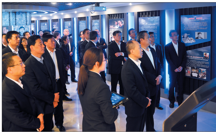
该行组织中层管理干部到武汉市检察院预防职务犯罪警示教育基地开展教育活动。

本报讯(通讯员乔文武 张莉 刘晖 王瑞芳)近年来,工行邯郸分行以“公开透明、公私分明、自律律他、廉勤并重”16字廉洁文化理念为引领,把廉洁文化建设贯穿于改革和发展中,使遵章守纪成为工作常态,推进了业务健康发展。