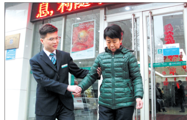
近日,石家庄普降小雪。农行石家庄新华路支行充实大堂服务人员,对客户细致提供的全方位服务。图为该行大堂经理搀扶送别老年客户。